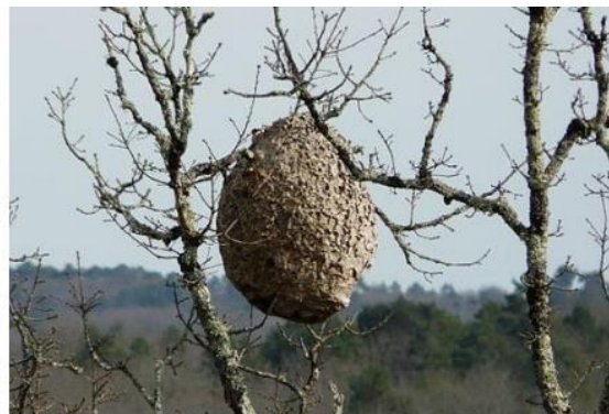
Abbildung 2: Nest in Baumkrone