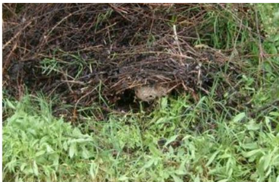
Abbildung 1: Vornest im Frühling http://www.hornissenschutz.ch/vespa-velutina-nth.htm

Die Königinnen bauen im Frühling kleine Vornester an einer geschützten Stelle. In den Sommermonaten werden die grossen Nester in den Kronen von Laubbäumen erbaut. In den Wintermonaten sind die verlassenen grossen Nester mit seitlichem Einflugloch dank der Laubfreiheit gut in den Baumkronen zu erkennen.